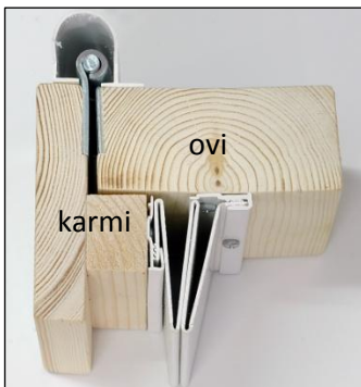
MK1A ja MK1B asennettuna oveen