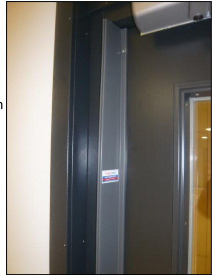
MK1A puisessa ovenssa, kun ovi on suljettuna.